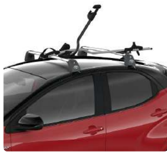
Поперечини даху, кріплення для велосипеда