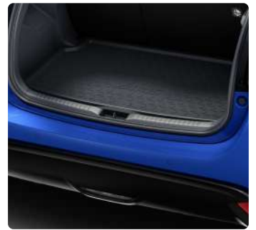
Килимки салону, гумові, Килимок багажника, гумовий