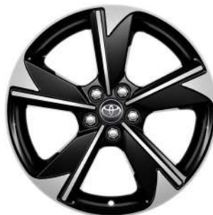
Легкосплавні диски 15", чорні