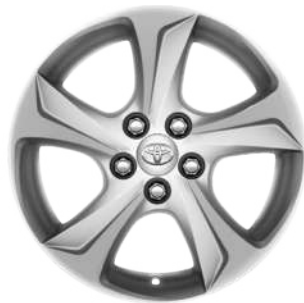
Легкосплавні диски 15"